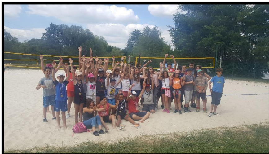
Tournoi annuel inter-centre de Beach volley